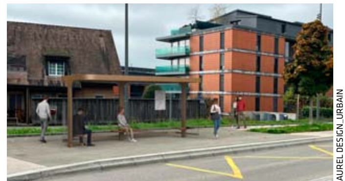
Les abribus seront disponibles en trois tailles différentes. Sur cette image de synthèse, l'arrêt projeté à la route du Stand. AUREL DESIGN_URBAIN

La mise en place de l'ensemble se fera en deux phases: la première dès 2026, la seconde en 2028. GBT